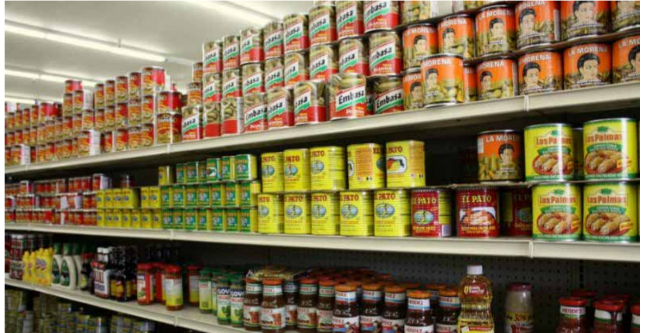
Mas como identificar um aditivo

dientes adicionados intencionalmente aos alimentos, sem propósito de nutrir. Eles modificam as características físicas, químicas, biológicas ou sensoriais do produto, durante sua fabricação, processamento, preparação, tratamento, embalagem, acondicionamento, arma-