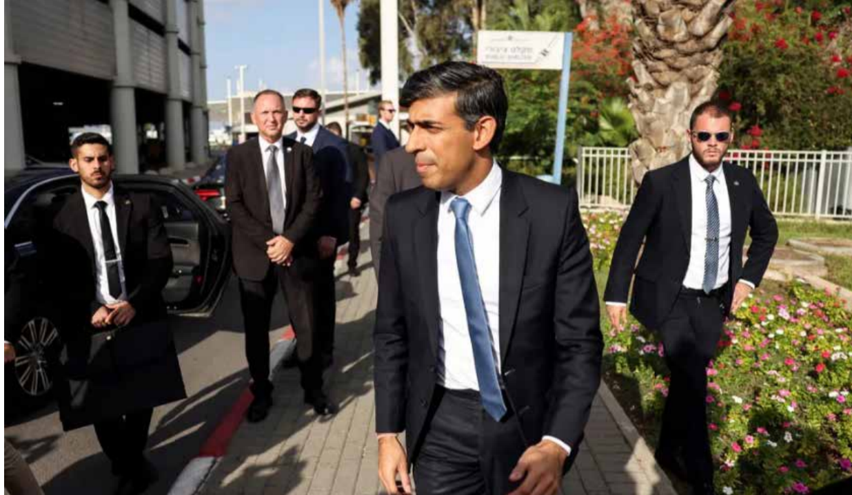
Primeiro-ministro do Reino Unido, Rishi Sunak, desembarcou em Tel Aviv

de terrorismo indescritível e horrível, e quero que saibam que o Reino Unido e eu estamos com vocês", disse.