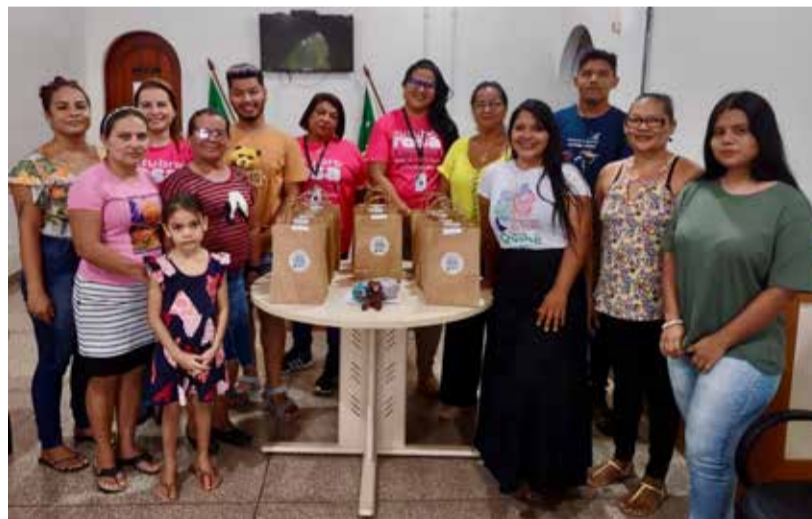
A seleção foi feita por meio dos processos judiciais afetos à temática de violência doméstica;