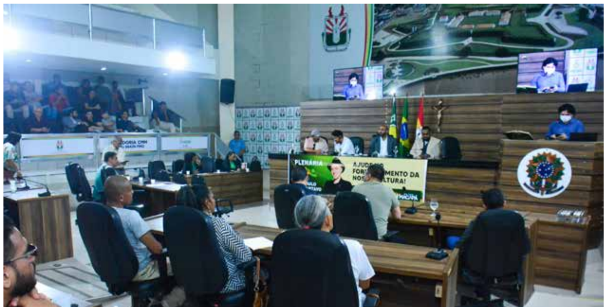
Fazedores de cultura participam da plenária da Lei Paulo Gustavo na Câmara Municipal de Vereadores.