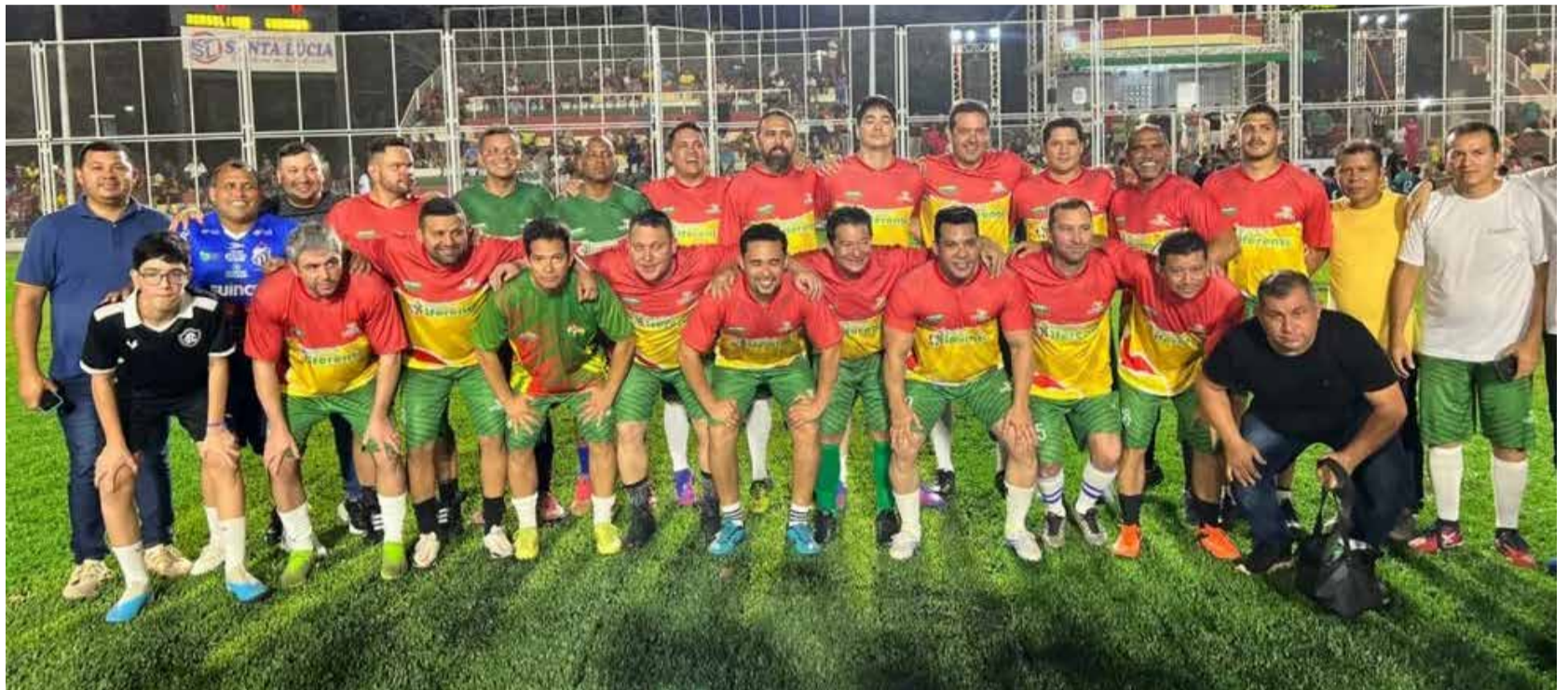
Servidores públicos de Macapá em jogo amistoso na Praça Nossa Senhora da Conceição

Os jogos de iniciativa da Prefeitura de Macapá, tem o objetivo de promover integração social e a prática de hábitos saudáveis.