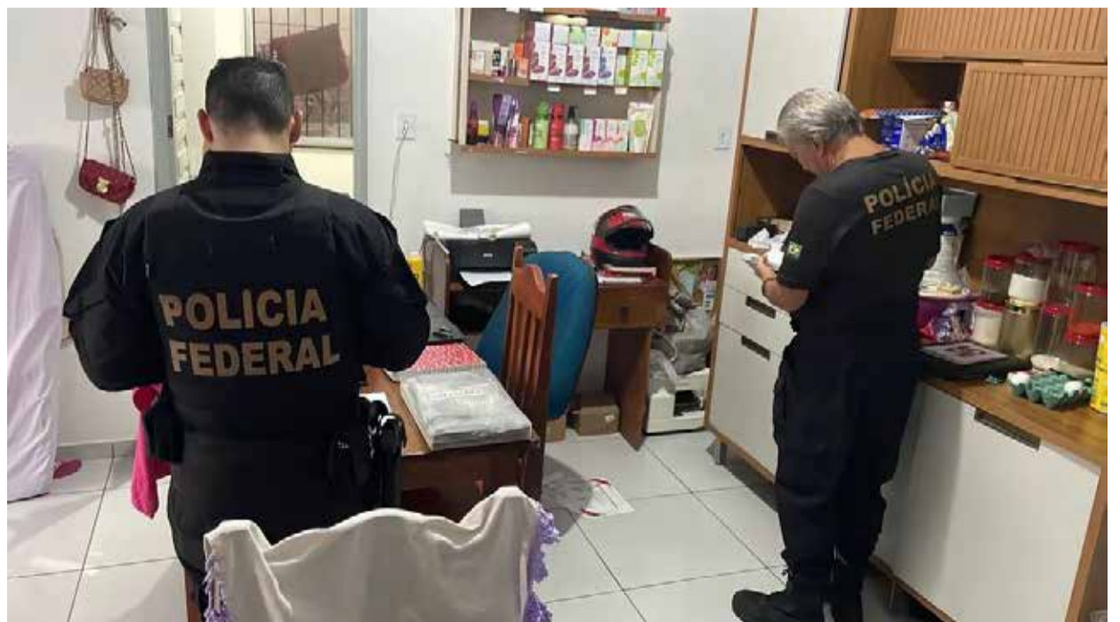
Policiais durante o cumprimento de mandado de busca e apreensão.

Com a ação de atravessadores de Muaná a Abaetetuba, “havia mais uma exigência: era necessário comprar um seguro de R$