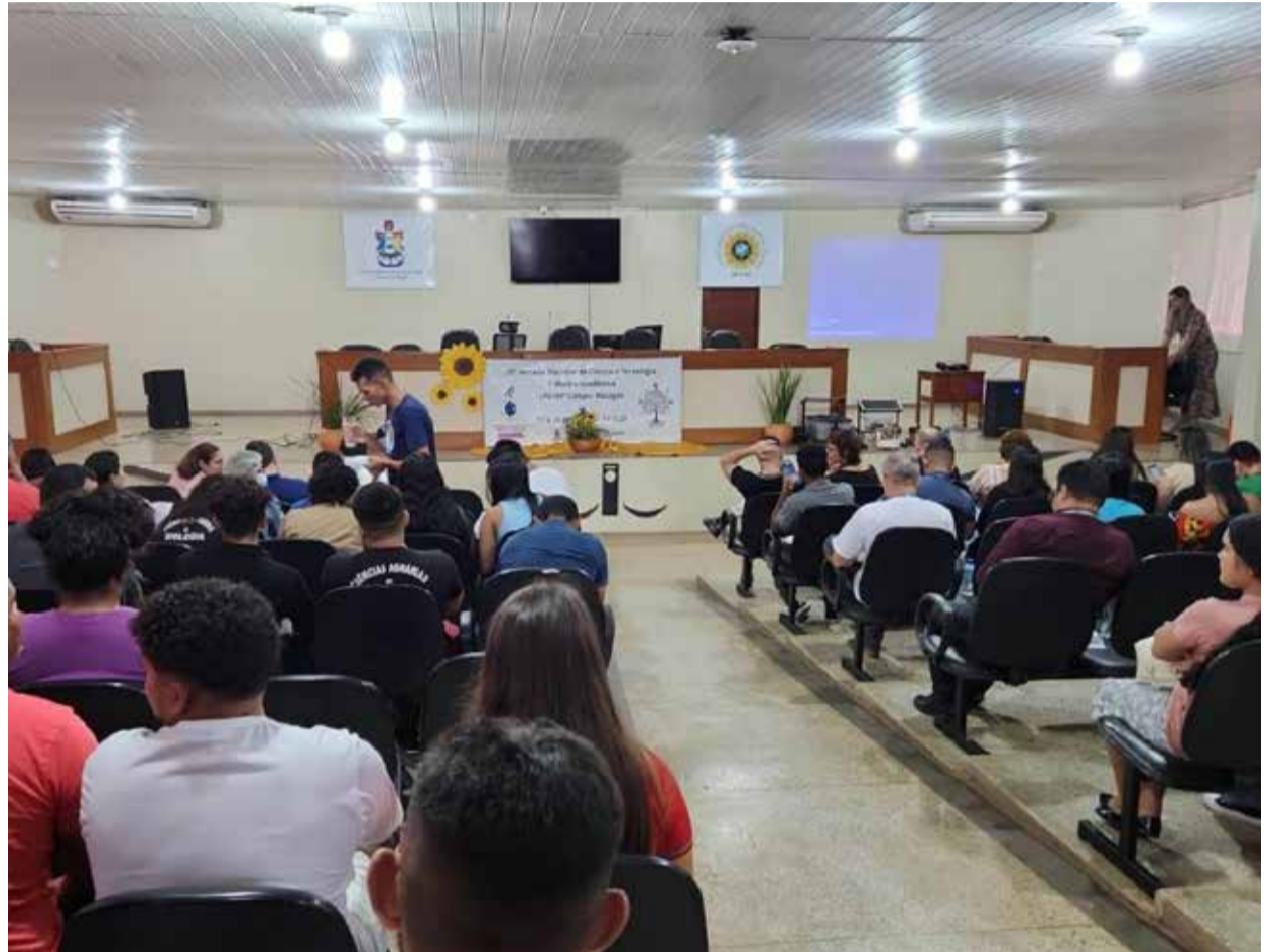
O simpósio ocorrerá até dia 20 de outubro.

“Esse evento é muito especial, nós estamos aqui na Amazônia, temos essa biodiversidade imersa tão desconhecida, então nós precisamos de ciência”, finalizou o juiz Kopes.