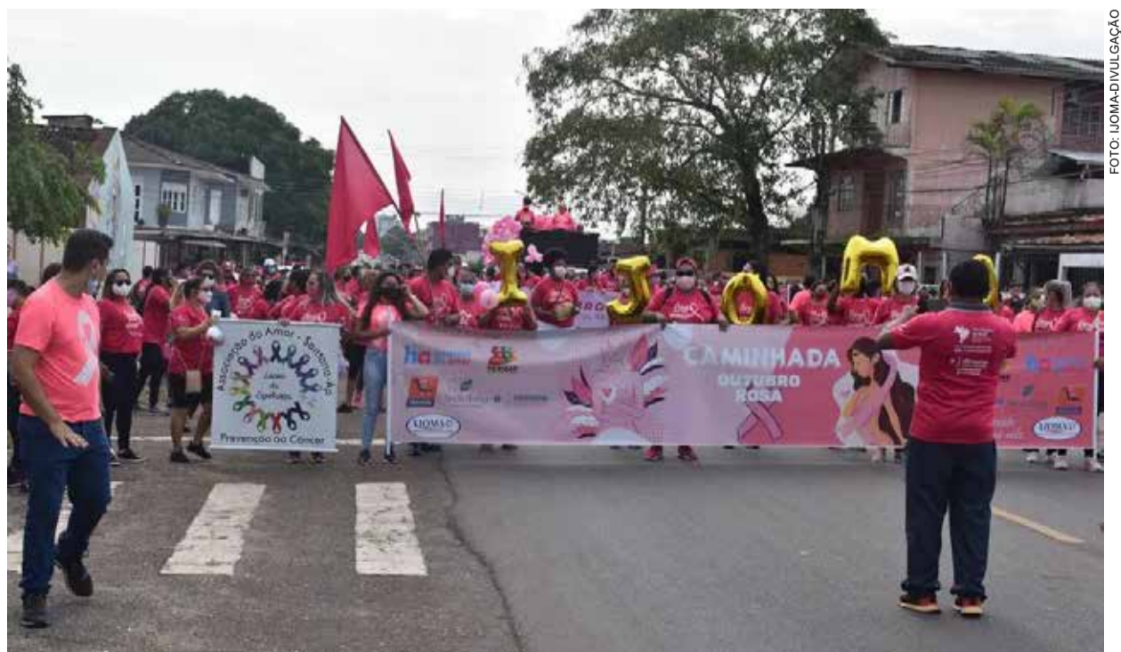
Caminhada Ijoma 2022.

Durante todo mês de outubro várias ações estão sendo realizadas, incluindo exames laboratoriais e palestras.