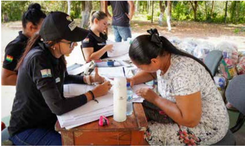
Semas leva ação da Prefeitura de Macapá para a Comunidade Quilombo Mel da Pedreira.

“Minha despensa estava vazia em casa, o atendimento e ajuda chegaram em boa hora. Esses produtos que vieram na cesta eu não tenho condições de comprar e,