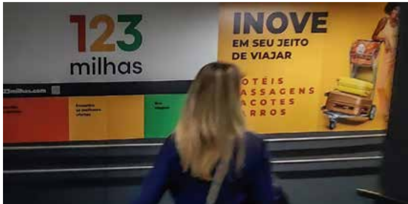
A 123 Milhas tem 20 dias para apresentar defesa.

Na época, a empresa informou que foi obrigada a suspender a linha promocional porque enfrentava custos maiores, principalmente dos preços das passagens. A 123 Milhas fez uma única proposta aos clientes: devolver os valores em vouchers, que só