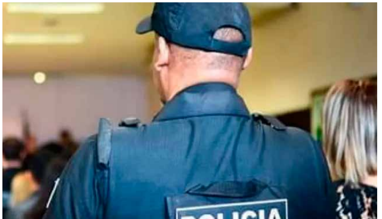
Candidatos devem ficar atentos ao prazo de dois dias para entrar com recurso

Em seguida, os candidatos serão submetidos às etapas documental, médica, psicológica e de investigação social. Os aprovados em todas as etapas estarão aptos a realizarem o curso de formação.