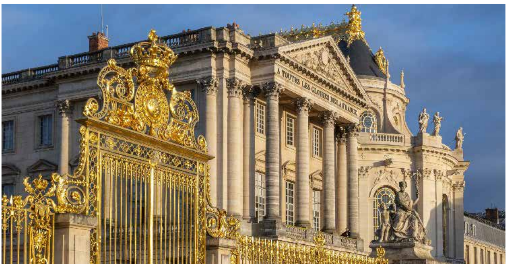
Por razões de segurança, o Palácio de Versalhes evacuará os visitantes.

A residência construída no século XVII por Luís XIV, o "Rei Sol", a cerca de 20 quilômetros a sudoeste de Paris, havia sido evacuada pela primeira vez na tarde de sábado, devido a um